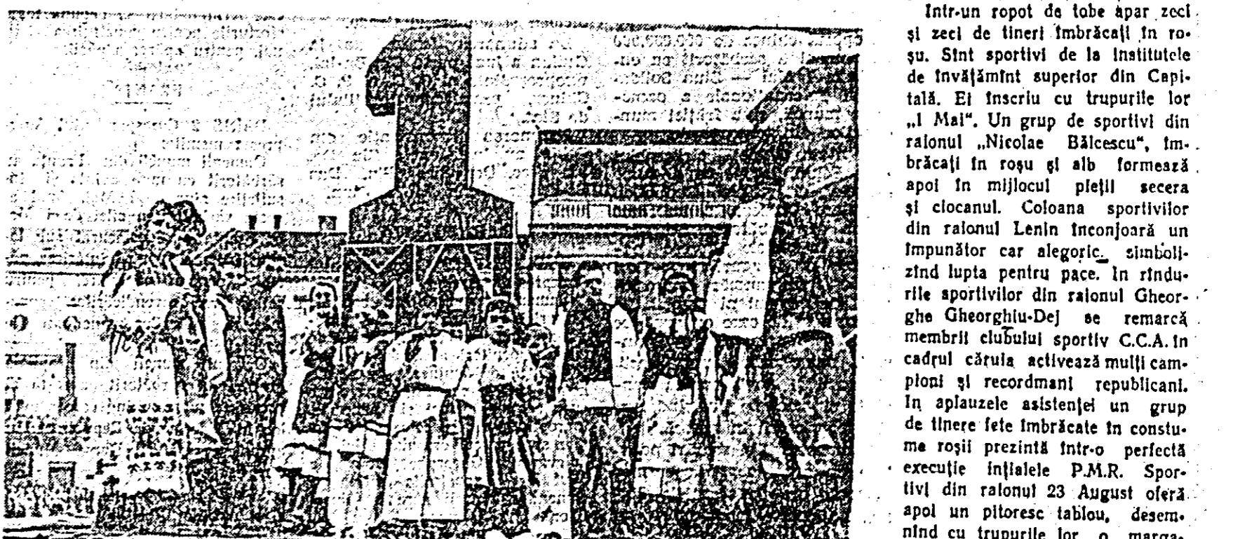
Carul alegoric al fabricii „Tricoul roșu”