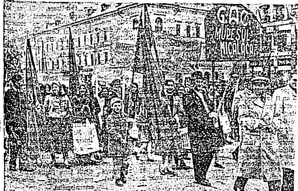
În rîndurile demonstrațiilor au părut cu mîndrie și colectivității din Mîclăcea.

În tribuna rezervată corpului diplomatic au loc șefii ai misiunilor diplomatice acreditate la București și alți membri ai corpului diplomatic.