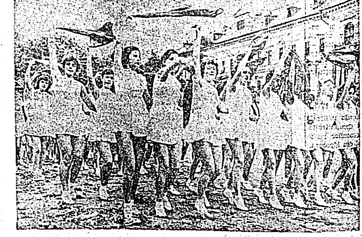
Fluturînd eșarfe roșii, demonstrează tinerile sportive. Ele au executat în fața tribunei frumoase exerciții de gimnastică.