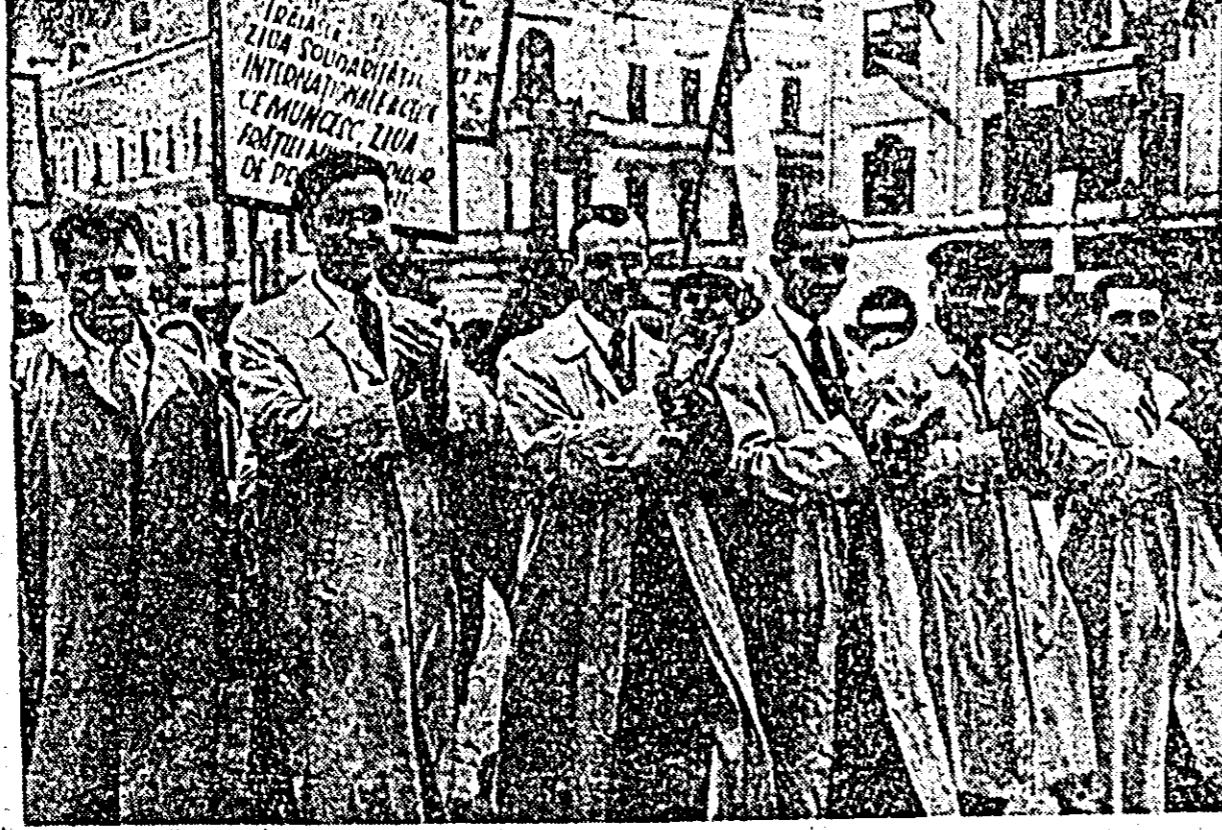
Veseli, optimiști, trec muncitorii de la uzinele „Gheorghe Dimitrov”.

La marea demonstrație de 1 Mai, oamenii muncii din orașul și raionul Arad și-au exprimat toată hotărârea, dragostea și atașamentul lor nefermînt față de partidul nostru drag, organizator și inițiator al tuturor victoriilor noastre, față de patria noastră scumpă Republica Populară Romînă, față de marea popor sovietic și de gloriosul său partid. Totodată ei și-au manifestat solidaritatea cu toate popoarele care construiesc socialismul, cu toți oamenii muncii care luptă pentru pace, libertate și progres social. Marea demonstrație a luat sfîrșit. Dar pe străzile orașului parcă mai plutește vîntul ei. A fost o sărbătoare înfrîșătoare, frumoasă, o sărbătoare a primăverii, a tineretii. Fiecare om al muncii a sorbit din ea forțe proaspete, a simțit în suvoalele multmîmăreții cauzei de nălmînt al celor ce muncesc din toate țările.