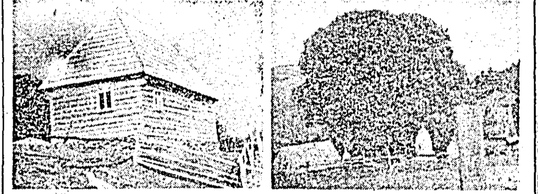
În cele două imagini: Casa Horii, reconstituită și uriașul frasin crescut pe locul vechii case.

și, fiindcă s-a prăpădit casa bătrîneasă a Horii, s-a îndalpat ceva mai sus, în șcaua dealului, o altă nouă, dar după asemănarea celui vechi, cunoscută după descrierea și desenul făcut la laja locului în 16 septembrie 1879 de către marele istoric Nicolae Densușianu ce vizita în acel an Munții Apuseni. Iar fiind va fi amenajată deplin, casa memorială va deveni loc de pelerinaj pentru toată sultarea românească. GHI. TIRCUS, jurnalist