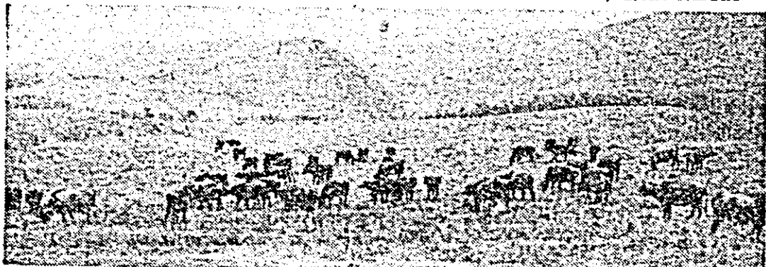
La Virfurî, pe pășuni colinare, pasc bubalnice, animale rezistente, ușor de întreținut și de la care se obțin cele mai valoroase produse lactate. ÎN FOTOGRAFIE: turmă de bivoli la pășune.

— Da, pentru zonele de șes, dar la munte nu merge, nu are picioarele rezistente la urcarea și coborîrea pantelor abrupte.