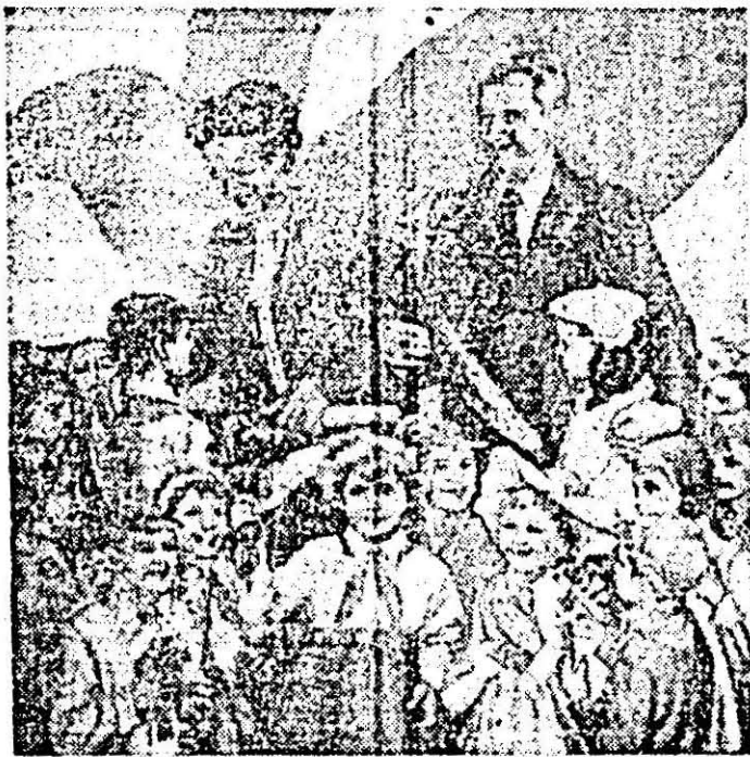
„Omagiu”, pictură de Constantin Nițescu.

Iată doar câteva sublinieri în planul împlinirii valorice ale spiritualității arăde-