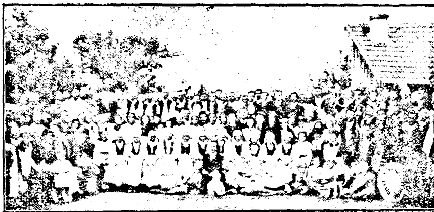
Grupul de participanți la ședința dela Cluj