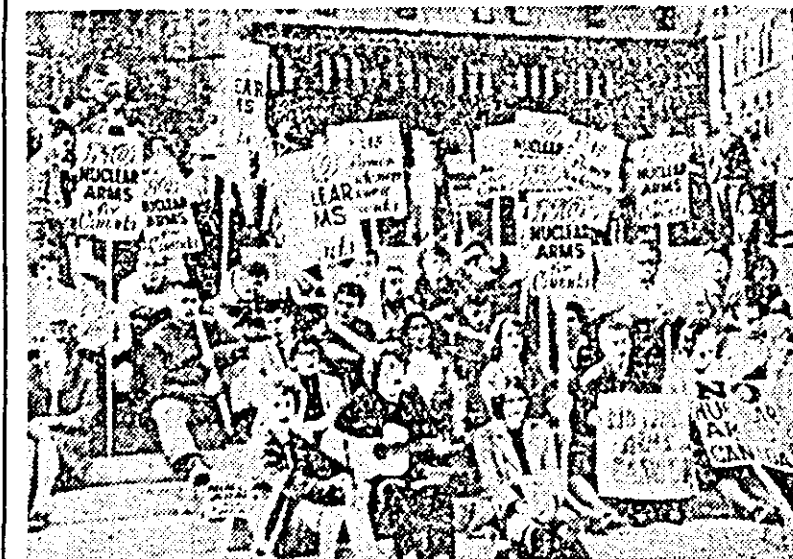
Mişcarea împotriva experţenţelor nucleare americane se desfăşoară cu intensitate crescînd în diferite ţări ale lumii. IN CLISEU: o demonstraţie organizată la Ottawa, în faţa clădirii parlamentului canadian.

In acelaşi timp, situaţia din Teminabun, primul oraş eliberat, s-a normalizat. Consiliul o-răseneşc şi-a reluat activitatea. Mişcările de transport, abandonate de colonialişti, sînt în prezent folosite de partizani. Autorităţile olandeze din Merauke, relatează ANTARA, şi-au exprimat îngrijorarea faţă de sporirea numărului celor care părăsesc oraşul pentru a se alătura partizanilor.