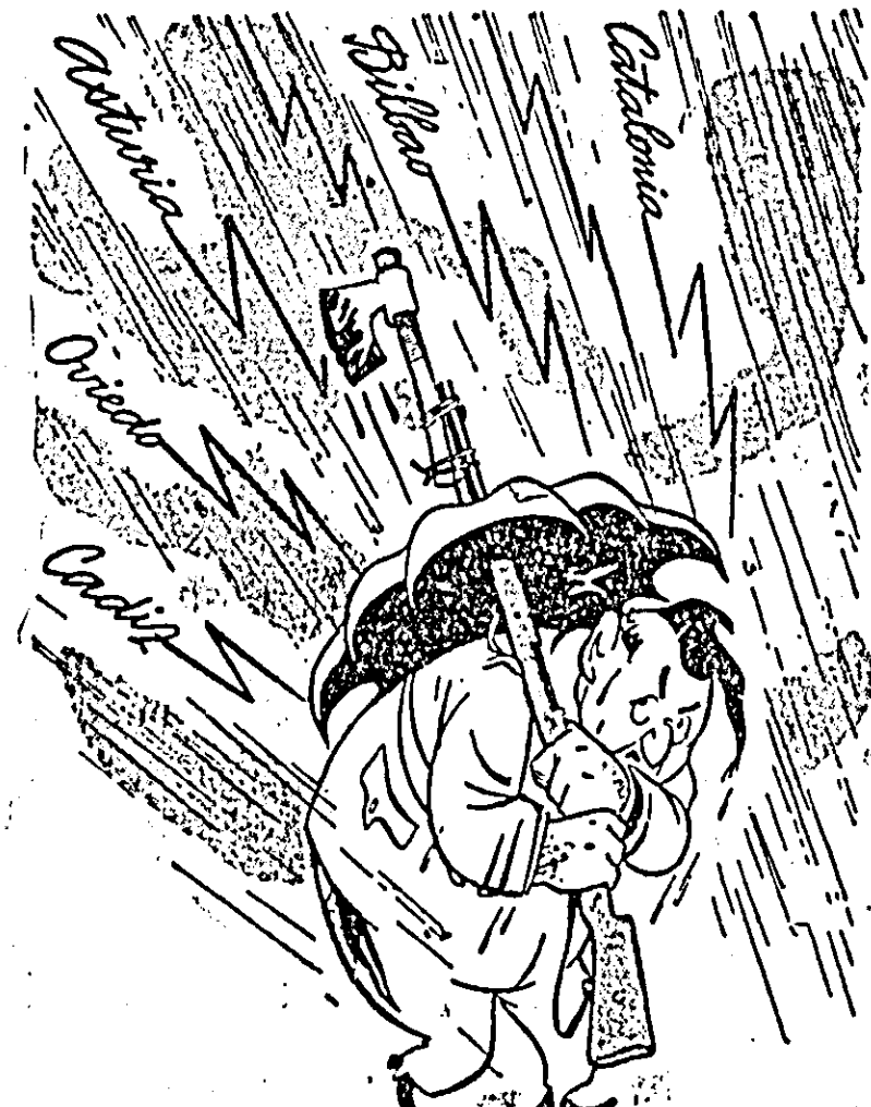
FRANCO: Iată un pătrăşnet care nu mă mai poate apăra... (Desen de RIK AUERBACH)