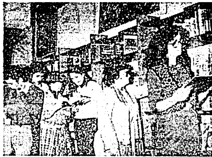
Biblioteca Casei de cultură a studenților cunoaște zilnic o mare afliuență de cititori de toate vîrstele.