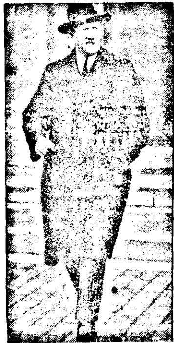
Der neue Reichsminister von Schleicher beim Verlassen des Reichswaldministeriums.

„Völkischen Beobachters“ Alfred Rosenberg sollen ebenfalls den Plan hegen, aus der Partei auszutreten. Auch ein großer Teil der Mitglieder ist schon längst nicht mehr zufrieden mit der Politik Hitlers, der eine Gelegenheit nach der anderen verpaßt, demzufolge wohl ein guter Volksredner, aber ein schlechter Politiker ist.