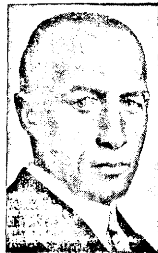
Der bekannte Wirtschaftstheoretiker der Nationalsozialisten, ist ebenfalls ausgetreten.