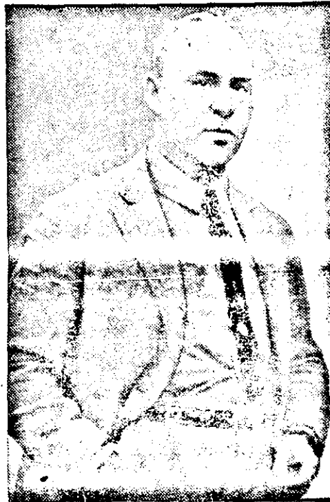
Gregor Straßer welcher angeblich wegen einem Zerwürfnis mit Hitler aus der Nationalsozialistischen Partei ausgetreten ist.