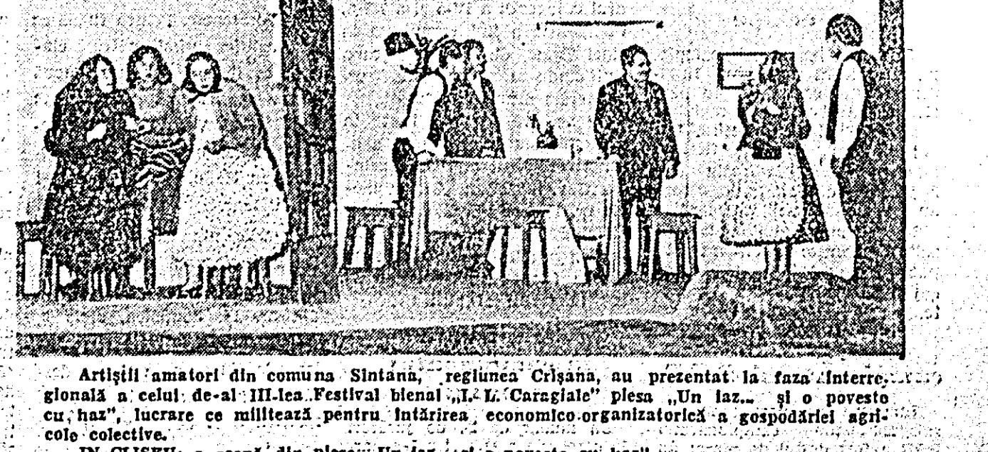
Artiștii amatori din comuna Sintana, regiunea Crișana, au prezentat la faza interregională a celui de-al III-lea Festival bienal „I. L. Caragiale” piesa „Un laz... și o poveste cu haz”, lucrare ce miitează pentru înfărirea economic-organizatorică a gospodării agricole colective.

Lăzărenii, o comună de deal din regiunea Crișana, a cunoscut în anii puterii populare un avînt nemălîntînit nu numai pe țărîm economic, ci și cultural-artistic. Aci, în jurul căminului cultural, își desfășoară activitatea numeroase formații artistice de amatori. Dintre acestea formația de proză a ajuns, în cadrul celui de-al III-lea Festival bienal „I. L. Caragiale”, pînă la faza interregională.