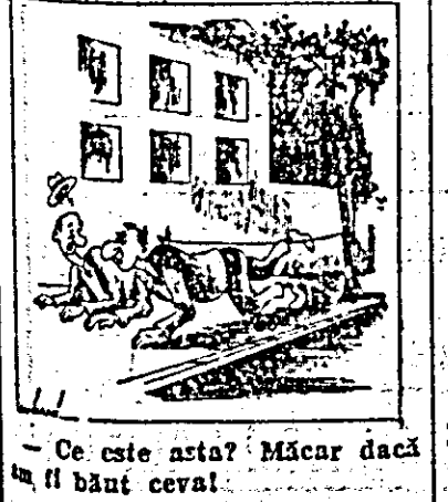
— Ce este asta? Măcar dacă ai băut ceva!

Pe strada Fraternității, în-țe clădirea școlii și unul din-ze copaci din marginea tro-tuarului, este întinsă o sîrmă care barcăază trecerea pietoni-lor. Nici o indicație suplimentară nu atrage atenția trecăto-rilor că această porțiune de trotuar este interzisă, astfel că în fiecare seară se întâmplă ca zeci de pietoni să se împiedice și să cadă.