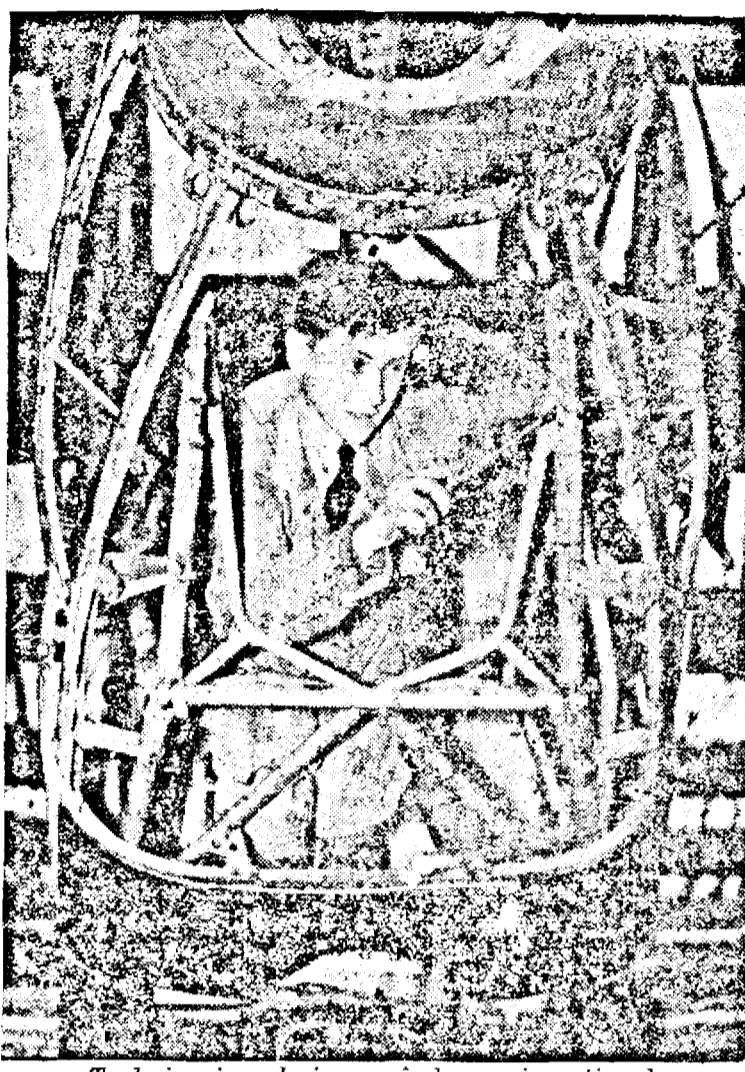
Technicieni englezi reparând un avion atins de proiectilele inamice