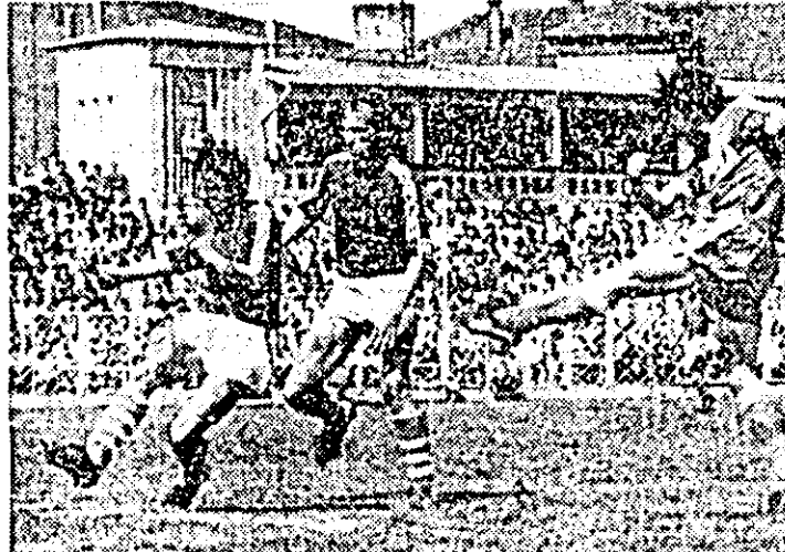
Fază din meciul UTA - Politehnica Timișoara.

partidel de la Arad. Cît privește UTA, ea oricum va pendula între locurile 4-7. Știind toate acestea, am mers la stadion cu gândul de a vedea măcar un joc spectaculos, așa cum ne-au oferit de atîtea ori cele două echipe. Am asistat la o primă repriză de bună calitate, cu tot ceea ce caracterizează un