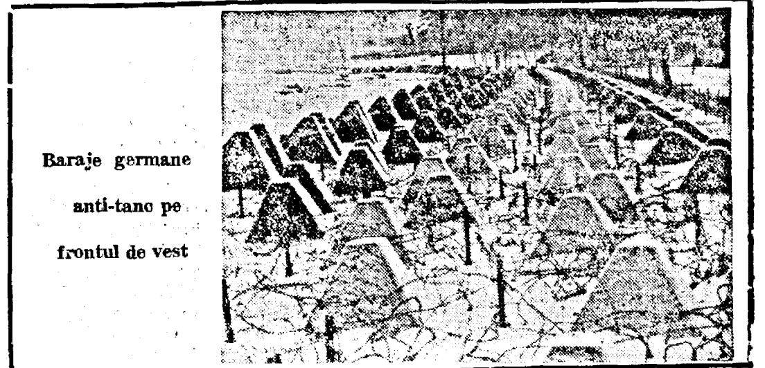
Baraje germane anti-tanc pe frontul de vest

Roma, 23. (Rador.) — HAVAS: ZIARELE ITALIANE ANUNȚĂ DIN SURSA IUGOSLAVA, CĂ D. VON RIBBENTROP, MINISTRU DE EXTERNE AL REICHULUI, SE VA DUCE ÎN CURÂND LA BELGRAD.