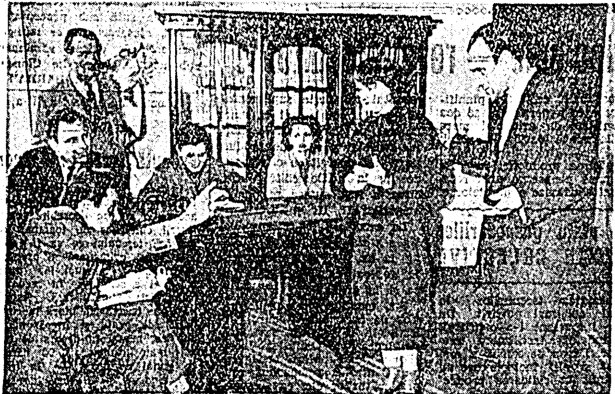
Aspect din timpul unei repetiții. Artiștii amatori din învățămînt repetă piesa „Doctor fără voie” de Moliere.