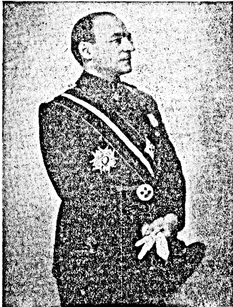
D. ARMAND CALINESCU președintele Consiliului de Miniștri

tate, din anul financiar 1938/1939, s'au încasat din rămășițe Lei 2.249.309, iar dela 14 August 1938 până la închiderea exercițiului financiar, adică șapte luni și jumătate, Lei 7.670.933. În total s'a încasat suma considerabilă de Lei 9.960.242 din totalul de Lei 10.942.338 înscris în buget la articolul „rămășițe din exerciții închise”, rămânând de încasat o sumă abia de 977.396 Lei.