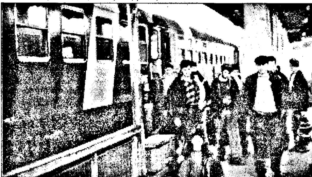
GARA CFR ARAD - UN LOC CARE NU ESTE NICIODATĂ PUSTIU...

schimburile de noapte, de dimineață sau de după-amiază.