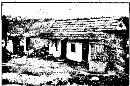
După ce și-au lăsat casa în paragină, s-au mutat abuziv la bloc...

la Grupul Școlar „I. Butcanu” din Gurahont, apartamentul cu pricina a fost ocupat în mod abuziv de familia de țigani. Aceasta s-a întâmplat în luna noiembrie a anului trecut, când respectivul apartament a rămas liber prin transferul fostilor chiriași în altă localitate. Familia care a ocupat apartamentul s-a mutat „la bloc” venind de... vizavi! Chiar peste drum de bloc se poate vedea locuința dărăpănată lăsată în paragină de familia cu pricina... „În Vârfurile, noi ne-am mutat în 1991 și am depus o cerere la Primărie pentru un apartament în blocul