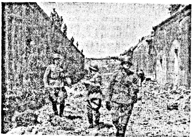
Soldați germani în forturile belgiene

legătură sunt telegrafia fără fir, motocicletă și ciclul, chiar călăreții și înfățișat curierii pedestri.