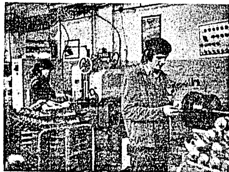
Aspect de muncă în atelierul freze de la I.M.A.I.A.