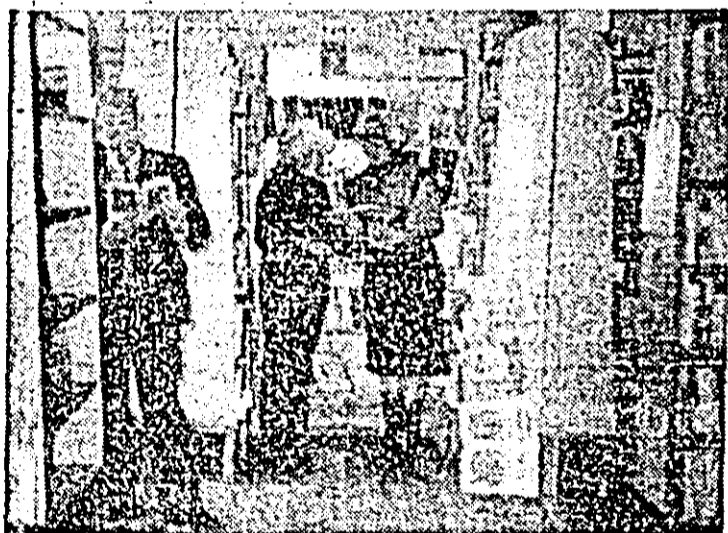
Aspect din biblioteca orașenească Nădlac.