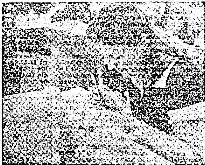
„Arădeanca” — atelierul de pictat. Muncitoarea Lenuța Dragoș se remarcă prin pricepere și hărnicie la locul de muncă.

adică aproape jumătate din planul însămînțărilor de primăvară. S-a încheiat complet semănatul cîneplii și se apropie de final plantatul cartofilor. Însămînțatul soiului care a demarat săptămîna aceasta, s-a efectuat pe mai bine de 3 000 ha. Cum se apropie termenul de 15 aprilie, dată stabilită în județ pentru încheierea însămînțării porumbului, se cere ca toate forțele să fie mobilizate și azi pe ogoare pentru realizarea și depășirea vitezelor de lucru stabilite.