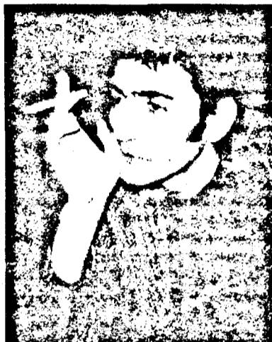
criminalist (detectiv) sau actor.

- Detectiv. Când eram mic aveam două visuri: să ajung procuror