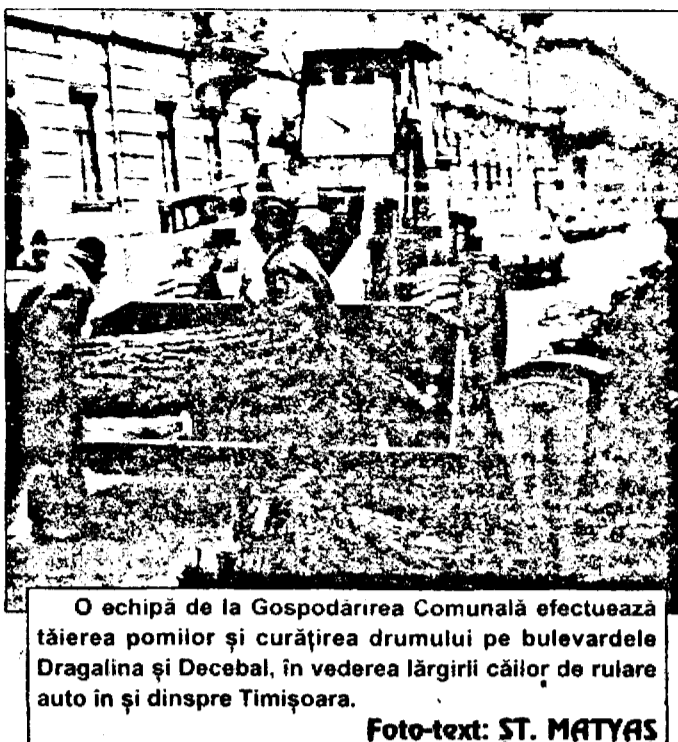
O echipă de la Gospodăria Comunală efectuează tăierea pomilor și curățirea drumului pe bulevardele Dragalina și Decebal, în vederea lărgirii căilor de rulare auto în și dinspre Timișoara.

Deși greva feroviarilor maghiari a încetat TRENURILE INTERNAȚIONALE AU AJUNS CU O ÎNTÂRZIERE DE ȘAPTE ORE LA ARAD Ieri, în jurul orei amiezii, feroviarilor maghiari au încetat greva. Primul tren care a trecut granița pe la Curtici a plecat din Gara Arad la ora 16,38, adică normal, după cum ne-au declarat cei de la „Informații CFR”. În ceea ce privește trenurile care trebuia să ajungă la Arad, venind dinspre Ungaria, întârzierile au fost foarte mari. Trenul internațional care trebuia să sosească la Arad ieri, în jurul orei 14,00, nu ajunsese decât după ora 21,00. Întârzieri serioase au înregistrat și celelalte trenuri care trebuia să sosească aseară, la Arad, trenuri ce au avut punct de plecare Budapesta. Despre greva feroviarilor maghiari începută luni vă putem informa că, în cursul săptămânii viitoare, oricând poate reînchepe. Asta în cazul în care negocierile dintre feroviarilor și administrația de la Budapesta nu vor ajunge la nici un rezultat. N. O.