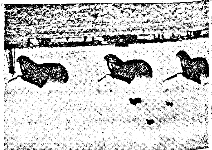
Baloane captivate pentru apărarea spațiului aerian britanic