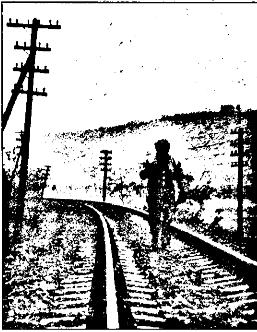
Un alt mod de a călători pe calea ferată