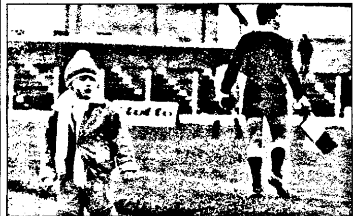
„Am hotărât, arbitru mă fac”.