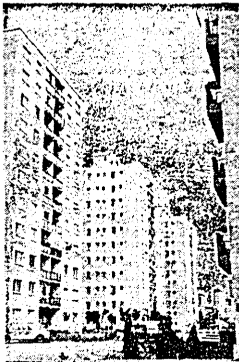
Ilustrată arădeană... Inedită.