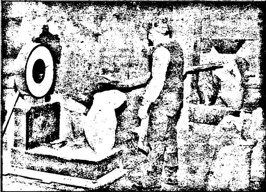
La fostul ARCOMB cântărirea nutrețurilor (și ambalarea) se face așa cum se vede în imagine.