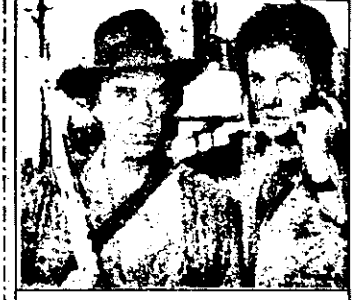
PRO 7 : 23, 05 Kung Fu - serial acțiune SUA

9,00 Știri ITN 9,15 Bursa SUA 9,30 Jurnal NBC 10,00 Supershop 13,00 Știri economice CNBS 13,30 Financial Times - rep. 14,00 Azi - magazin informativ 15,30 Roata banilor - informații de pe Wall Street 18,30 Știri economice europene 19,00 Azi - magazin informativ 20,00 Știri ITN 20,30 În direct - magazin muzical 21,00 Dateline - mag.social-politic 22,00 Sport magazin: golf