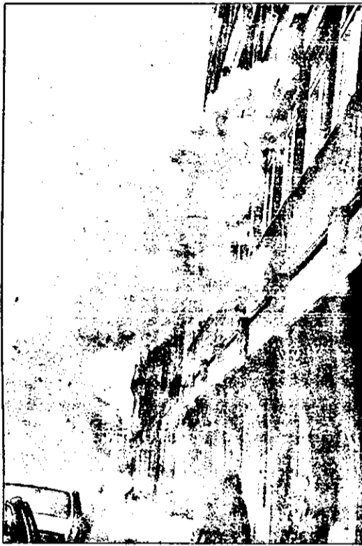
Nu, nu e vorba de nici un incendiu, ci de un mod „ingenios” de a evacua aburul rezidual folosit de atelierul de croitorie de pe strada Eminescu. Deci, nu undeva la periferie, ci în plin centrul municipiului.