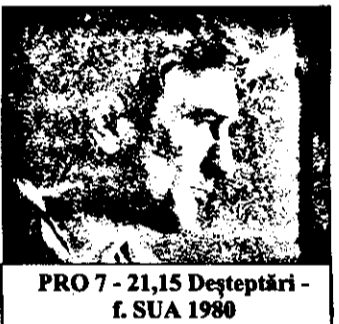
PRO 7 - 21,15 Deșteptări - f. SUA 1980

8,29 Prezentarea programului 9,02 Școala Iuliei 9,35 Video-amatori 10,05 Manual și joc - magazin