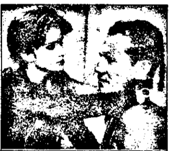
SAT 1 : 21,15 Schwartz intervine - serial polițist Germania

14,00 Vaporul iubirii - s.american: Învățătorul și fata 15,00 Vecinii - s. australian: Criză de slăbiciune 15,30 Alf - s.american 16,05 Bonanza - s.western am. 17,00 Star Trek - s.sf american 18,00 Concursuri tv 20,00 Știri, sport, meteo 20,30 Roata norocului - concurs-spectacol 21,15 Schwartz intervine, s.polițist