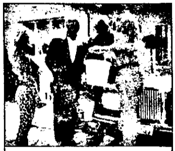
RTL - 21,15 Smintitii Flodderi - s. distractiv Olanda

10,45 Comoara condorului de aer - reluare 12,30 Roseanne - reluare 13,00 Bill Cosby show 13,30 Spertioarea și Mrs King - s. 14,35 Dynasty - s. am.: Adevăr amar 15,25 Hardcastle și McCormick - s. am. 16,20 Trei surori grăsuțe - s. am. 16,50 Adevărații vrăjitorii - nou serial american 17,25 Desene animate 18,55 Parker Lewis - s. distr. am. 19,25 Aripă - s. distractiv am. 19,55 Roseanne - s. distractiv am.