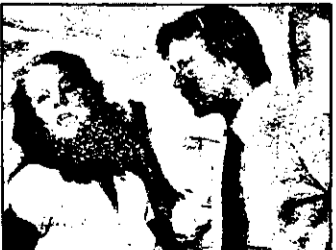
PRO 7 : 21,15 Căldura trupului - film polițist SUA 1981

BUDAPESIA-1 7,05 Viața satului 7,25 Jurnal regional 7,35 Știri economice 7,45 Știri 8,00-10,00 Magazin matinal 10,00 Magazin 10,30 Riviera - serial 11,30 Copil dificil - s.german VIII/4 12,30 Telegazeta 13,00 Știri 16,10 Viața satului - reluare 16,30 Vitrina - mag. informativ 17,00 Telegazeta, meteo 17,11 Vitrina - magazin 17,25 Telesport 17,58 Cazuri externe s.Olanda-Canada 18,30 Documentar 19,00 Emisiune pentru tineri 19,20 Emisiunea comunităților evreiești 19,45 Pariem - em.-concurs 20,10 Desene animate 20,30 Telegazeta 21,10 Anotimpuri capricioase - mag.distractiv 22,05 Documentar - socialismul nelegiuit 22,47 Vițetii - f.Italia, 1953 cu Alberto Sordi