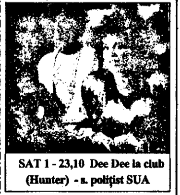
SAT 1 - 23,10 Dee Dee la club (Hunter) - s. polițist SUA

7,00-21,00 Desene animate - s. Astăzi: Căsătorii în pericol