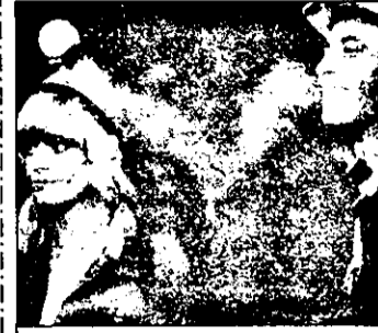
RTL - 18,00 Secretul Pesterii Fantomelor - f. SUA 1984

Richard Pryor 18,15 Star Trek - s. sf. american 19,15 Roata norocului 20,00 Știri, sport, meteo 21,15 Jane și orașul pierdut - f. aventuri Anglia, 1987 cu Sam Jones 23,05 Talkshow în turn