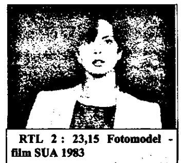
RTL 2 : 23,15 Fotomodel - film SUA 1983

10,55 Teletext 11,00 Jurnal parlamentar 17,00 Prezentarea programului;