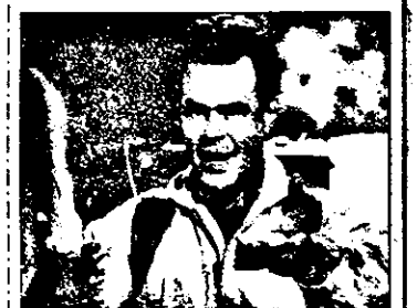
21,15 Vânătorii de fantome - c. SUA,

7,30 Știri NBC 8,30 Hello, Austria! - magazin 9,00 Știri ITN 9,30 Europa - magazin informativ