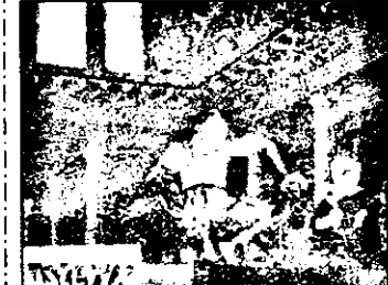
21,15 Muncile lui Asterix - f. de desene animate, Franța

18,50 Ruck Zuck - concurs TV 19,20 Zămbiți, vă rog! 19,55 Știri 20,00 Concediu în stil italian - s. german