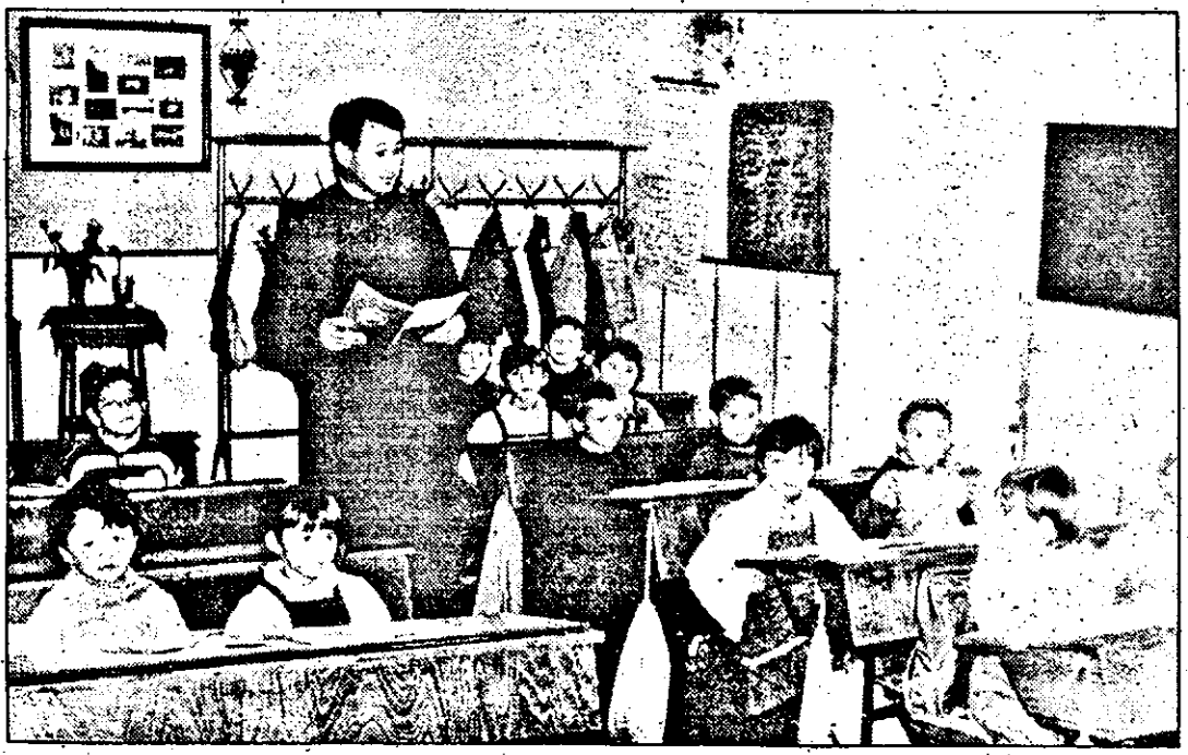
Preotul ortodox din Cermei pe „post” de învățător, ajutându-i pe cei mici să înțeleagă adevărurile sfinte.