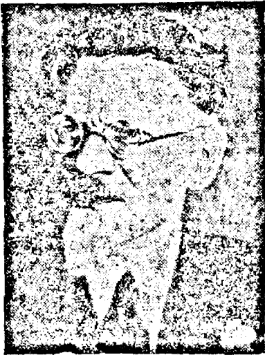
M. I. KALININ

Unii corespondenți au întrebat cum trebuie scris. Heine spune că ideea exprimată fără pasiune nu antrenează oamenii. Acest lucru este just. Belinski scria acum 100 de ani, însă nici până azi nu și-a pierdut marea sa influență asupra cititorului. Și de câte ori poate fi recitat Lenin. Vorbind despre aceste exemple, eu am în vedere, nu atât conținutul adânc al operilor lor,