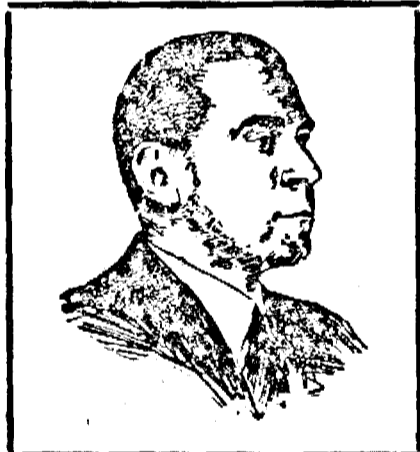
D. GH. TĂTĂRESCU

Unite) a sprijinit textul Marilor Patru, subliniind totuși că Statele Unite au fost de părere că o continuare a cercetărilor ar fi putut duce la un aranjament ce ar fi redus substanțial numărul persoane-