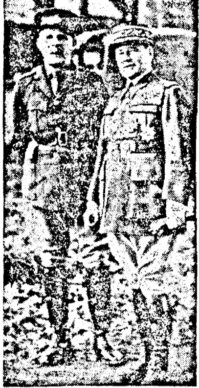
GENERALUL GORT, comandantul trupelor engleze pe frontul francez împreună cu generalul Gamelin

Paris, 1 (Rador). — Comunicatul oficial francez din 30 Noembrie anunță: Nimic de semnalat.