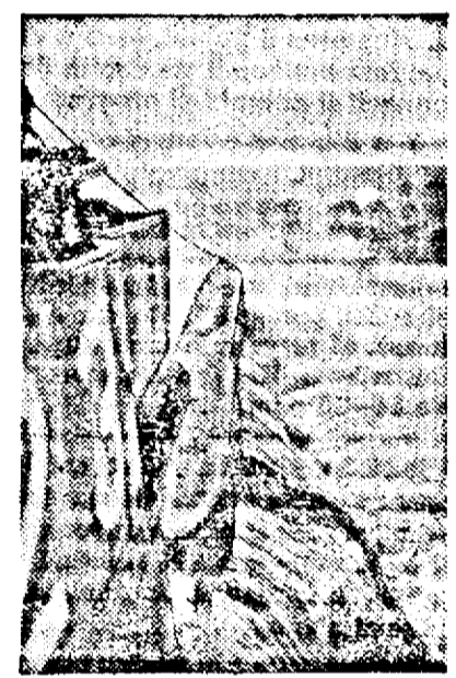
Un submarin al armatelor aliate stră- bate valurile Atlanticului.

Până la înființarea acestui institut, asigurările sociale acordă invalizilor din câmpul muncii ajutoare bănești potrivit claselor de cotizare și pensii în raport cu gradul incapacității lor de muncă.