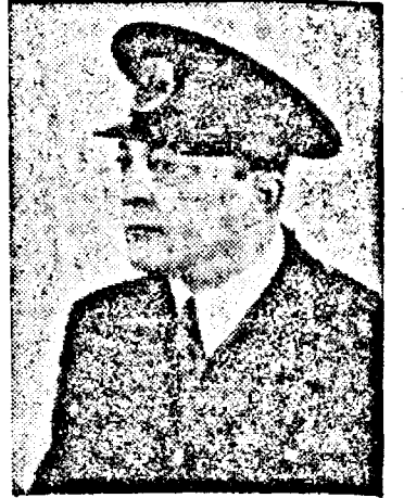
D. ALEXANDRU RADIAN ministru al Propagandei

a revenit la ministerul Propagandei Naționale