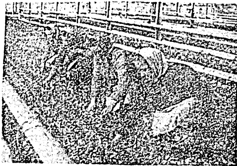
Muncă intensă la C.A.P. Aradul Nou. Se pregătesc răsădirile pentru solarul.