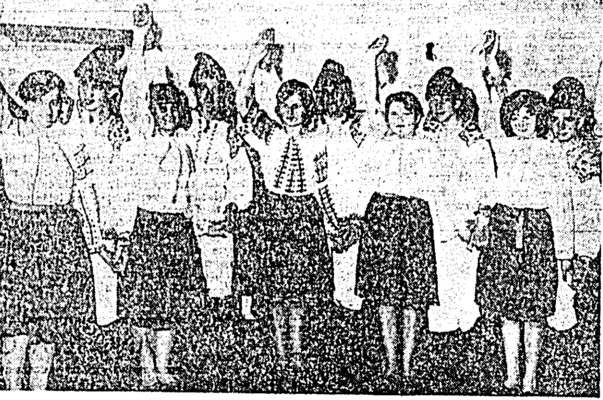
In clîșcu: formația de dan-suri populare din satul An-drei Șaguna, care a partici-pat la concursul folcloric de duminică.