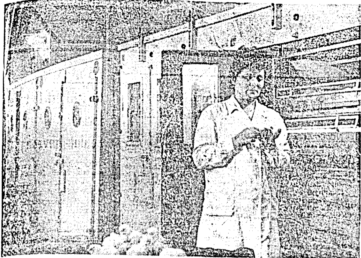
La Stațiunea de Incubație IRAVICOOP se obține în prezent cea de-a cincea serie de pul din actualul sezon. Până acum s-au obținut peste 20.000 pul, care au fost trimși către cooperativele agricole de producție. IN CLISEU: Ciliiva din pușorii abia scoși din găoace de către cloșca artificială.