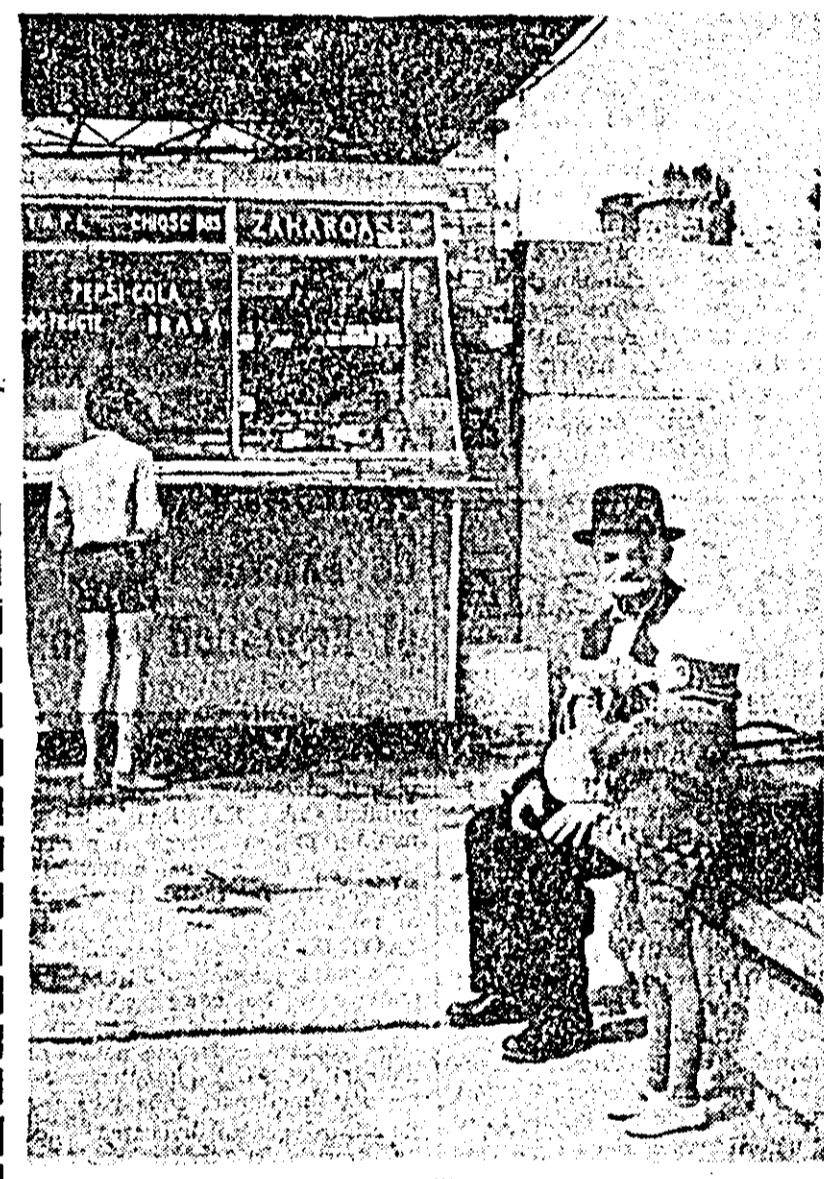
O clipă de odihnă.