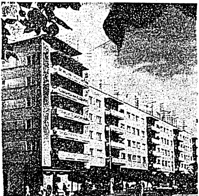
Din noul peisaj al Aradului.