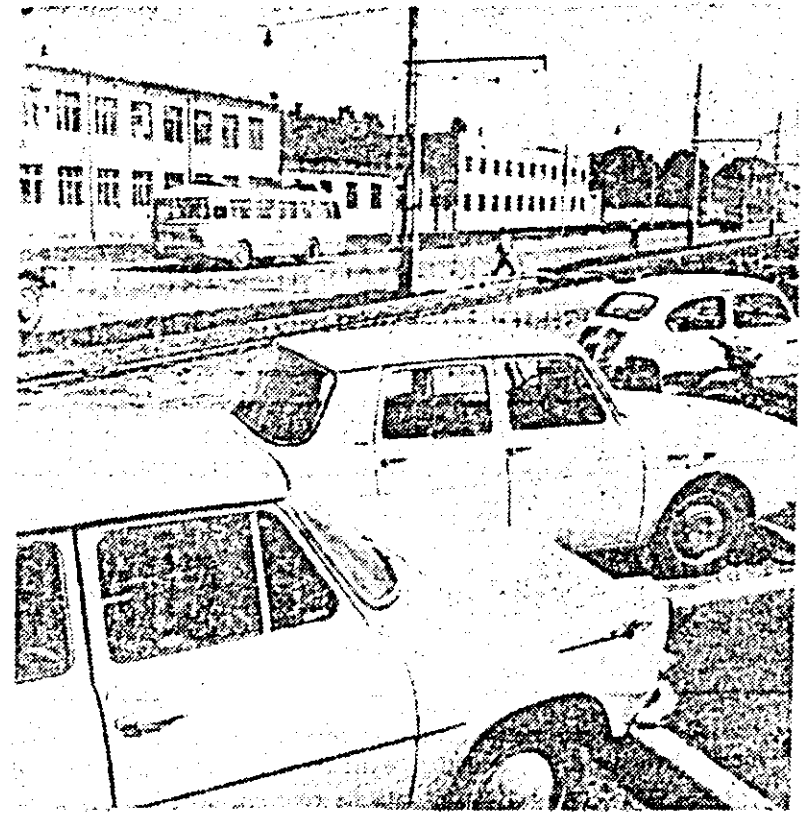
Pe magistrala arădană.