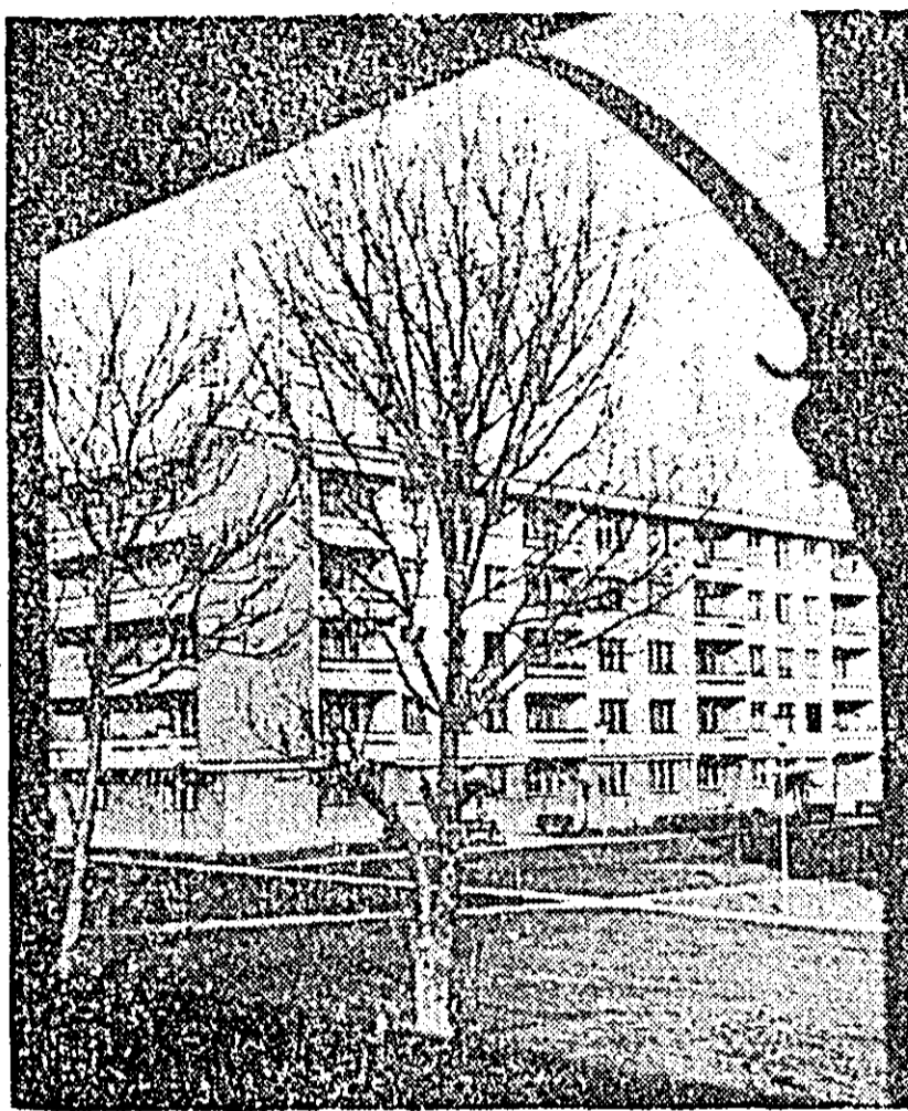
Din orice unghi ai privi blocurile noi din cartierul Podgoria, ele apar suple și elegante imprimind o notă de frumusețe în plus acestei porțiuni a orașului nostru.