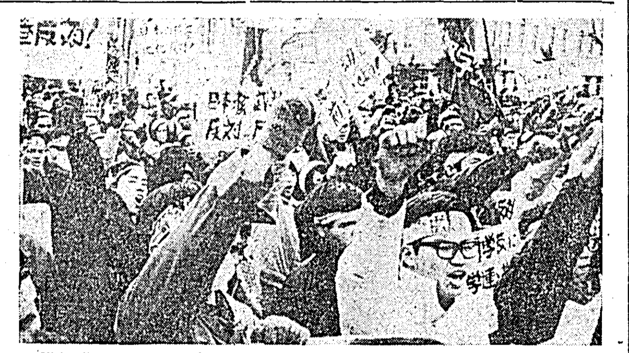
Vizita flotei militare americane în porturile japoneze a stîrnit o furtună de proteste în rîndurile poporului japonez. Fotografia înfățișează un aspect din timpul recentelor manifestații de protest din Tokio.

ASUNCION 12 (Agerpres). — În urma modificărilor constituției, care permit alegerea pentru a treia oară a unui președinte, alegerile prezidențiale care s-au desfășurat duminică în Paraguay nu au produs surprize. Într-un mesaj dat publicității de către președintele partidului guvernamental „Colorado” (Asociația națională republicană), Juan Ramon Chavez, a declarat că generalul Alfredo Stroessner, actualul președinte al Paraguayului, a fost reales cu o mare majoritate. El a afirmat, pe de altă parte, că și în alegerile pentru adunarea legislativă, partidul „Colorado” a obținut majoritatea. Potrivit rezultatelor preliminare cunoscute pînă acum, generalul Alfredo Stroessner, din partea partidului „Colorado”, a obținut 415 000 de voturi, Gustavo Gonzalez, candidat din partea Partidului liberal radical — 123 581 de voturi, Carlos Lovi Ruffinelli din partea Partidului liberal — 26 724 voturi și Carlos Caballero Gatii din partea partidului „Fecreista” — 15 044 voturi.