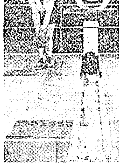
În clișeu: aspect din întâlnirea UTA—Bumbacul Timișoara.

vut loc la Timișoara, sportivii arădeni au evoluat sub posibilitățile lor reale. În consecință au pierdut cu severul scor de 4584:4938.