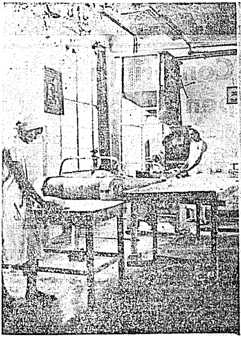
La secția nr. 3 a Întreprinderii de panificație divizarea și modelarea aluatului pentru piine se face mecanizat. IN FOTOGRAFIE: utilajele de divizat și modelat în lucru.

Acțiunea de organizare științifică a producției și a muncii va sta permanent în atenția noastră, urmărind pe această cale creșterea eficienței economice, realizarea în cele mai bune condițiuni a sarcinilor trasate de partid.