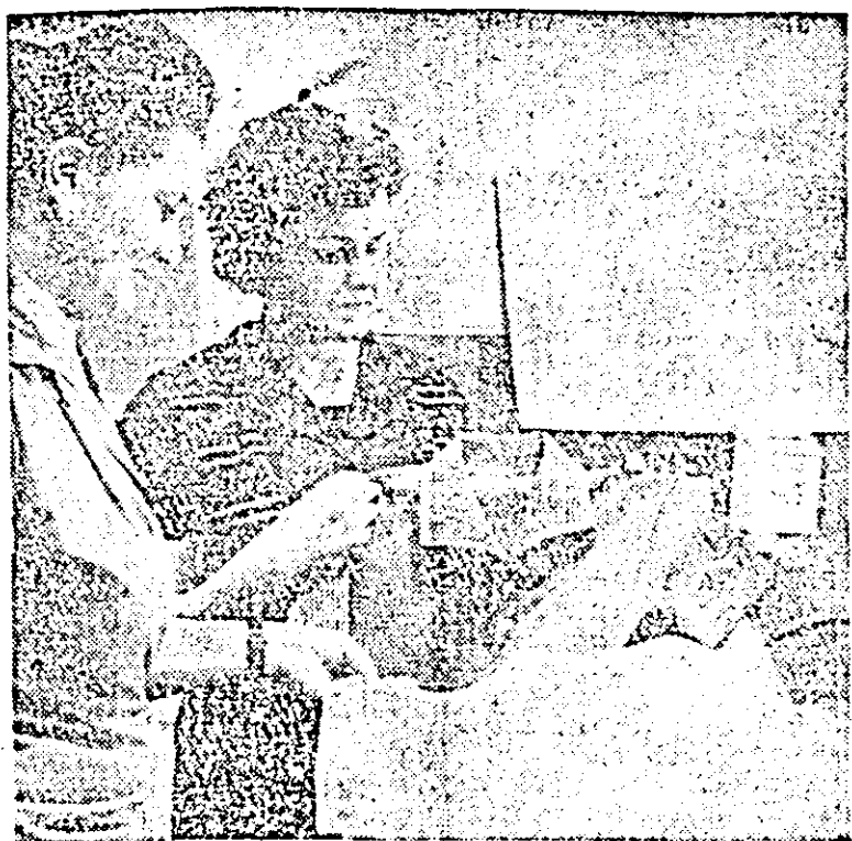
Tricotaje produse în sortimente variate la Întreprinderea „Tricolor roșu” se remarcă prin linii simple și eleganță, fiind realizate aproape în totalitate din contexturi noi.