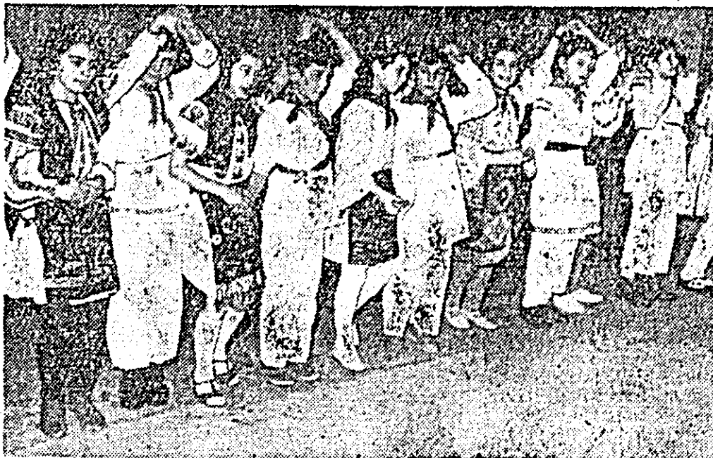
ÎN CLISEU: formația de dansuri de la Școala generală nr. 4, în timpul concursului.

larga popularizare și difuzare a cărții. Astfel, numai în ziua de 1 februarie au luat drumul spre cooperativele sătești mii de volume de cărți noi. Cooperativa de consum din