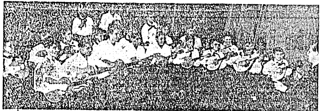
O frumoasă comportare în concurs a avut-o orchestra Casei de copii școlari nr. 2, pe care o prezentăm în clișeu de față.