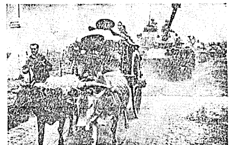
Scenă ce poate fi descrisă în lălmășie pe șoselele Vietnamului de sud: o familie sud-vietnameză, care s-a stins tot avuții într-o căruță, fuge îngrozită din calea tancurilor americane.

WASHINGTON 1 (Agerpres). Comitetul național de luptă pentru o politică nucleară rațională din SUA, a dat publicității o declarație în care se arată că hotărîrea guvernului american de a relua bombardamentele asupra teritoriului Republicii De-