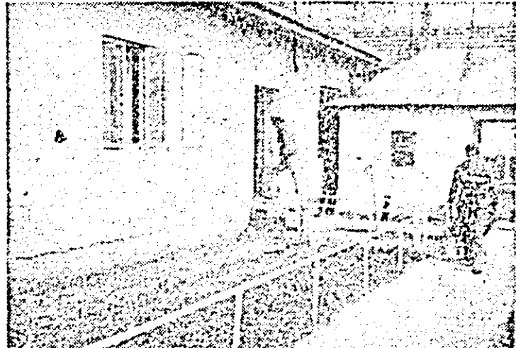
La Macea filtrul sanitar-veterinar e pe cale de finisare.

Pagină realizată de A. HARSANI