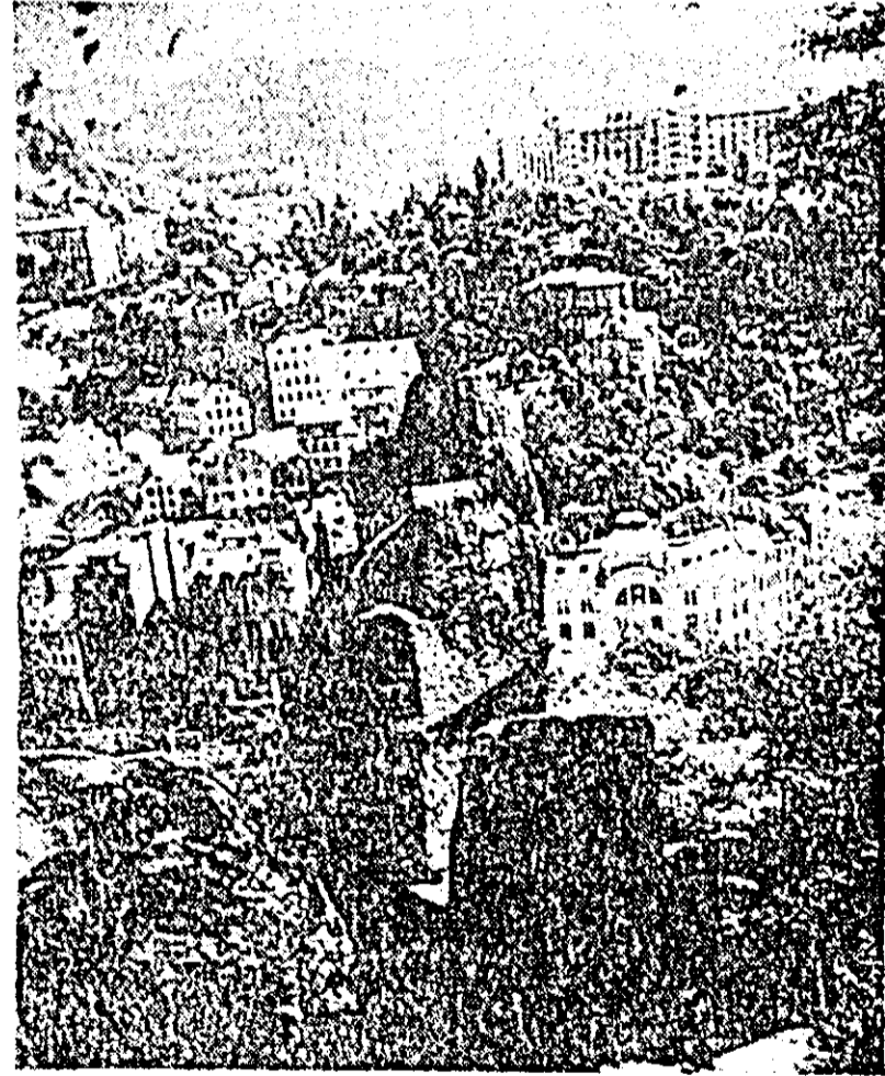
R. S. CEHOSLOVACIA. — Cea mai cunoscută stațiune balneară din R.S. Cehoslovacia este Karlovy Vary, situată într-o vale a micului rîu Tepla din Boemia de Vest. Din cele 12 izvoare accesibile pentru public cel mai mare este numit Sursa termală care are un debit de circa 2.000 litri apă caldă de 72,2 grade C, iar jetul ajunge pînă la înălțimea de 12 m. Aici se tratează în special bolile metabolice și ale aparatului digestiv. IN FOTO: Vedere din stațiunea Karlovy Vary.

Pe de altă parte, guvernul a preluat controlul asupra tuturor depozitelor bancare ale firmelor nord-americane „W.R. Grace and Co”, ale cărei plantații de trestie de zahăr de la Paramonga și Cartavio au fost expropriate. Un purtător de cuvînt al companiei a declarat că măsura luată de autoritățile peruvienne afectează bunuri ale firmei în valoare de 25 milioane dolari, dar societatea va continua să exploateze un combinat chimic și o fabrică de hîrtie.