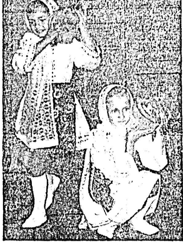
DANS SLOVAC JOC POPULAR FOTOGRAFII PRIMITE ÎN CADRUL CONCURSULUI DE LA TOV. ÎNVĂȚĂTOR A. LEHOTSKY (NĂDLAC).