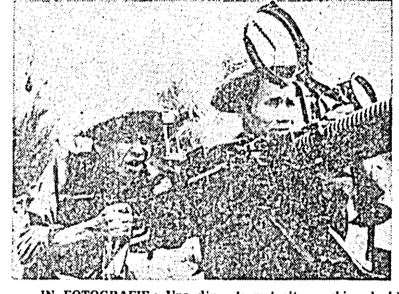
IN FOTOGRAFIE: Una din cele mai viteze echipe de bătrini care acționează în cadrul rețelei de apărare anti-aeriană...