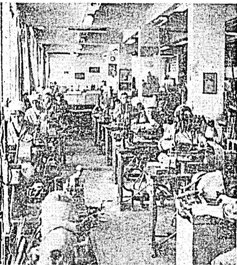
Vedere din atelierul uzinei al fabricii de ceasuri „Victoria”.

Proiectul de Directive al Comitetului Central al Partidului Comunist Român cu privire la perfecționarea conducerii și planificării economiei naționale corespunzător condițiilor noii etape de dezvoltare socialistă a României fixează drept principiu fundamental al activității în toate ramurile producției agricole, ridicarea continuă a eficienței economice. Aceasta înseamnă că în viitor orice activitate economică trebuie să corespundă unor nevoi reale, să fie rentabilă, adică să asigure recuperarea cheltuielilor de producție. În acest sens gestiunea economică proprie în Stațiunea de mașini și tractoare o considerăm ca fiind foarte necesară întrucât avem o puternică bază tehnico-materială, care ne permite să satisfacem cerințele de producție ale cooperativei agricole ce le deservim. În acest an, prin munca de zi cu zi a mecanizatorilor noștri, am reușit să ridicăm indicele de mecanizare de la 5,30 la 6,21 hantri, să realizăm planul de producție în proporție de peste 95 la sută,