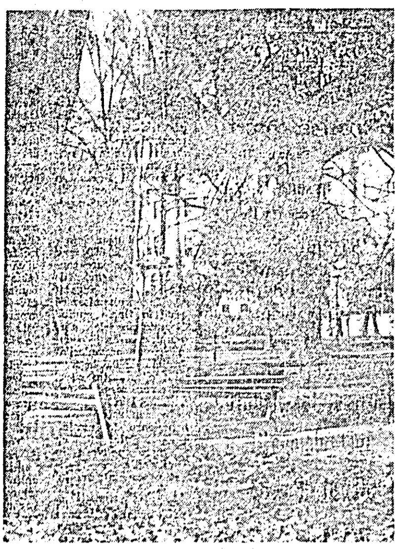
Peisaj autumnal arădean.