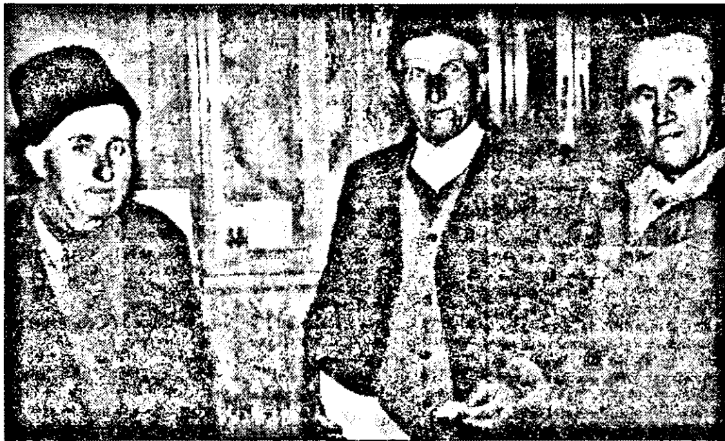
Dezorientați, oamenii au ajuns să nu mai știe de unde și până unde se întinde pământul lor.

Unele terenuri au fost acaparate cu scop de folosință definitivă, iar altele cu scop de folosință vremelnică.