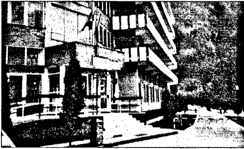
Complexul balnear „Codru Moma” își așteaptă permanent clienții.