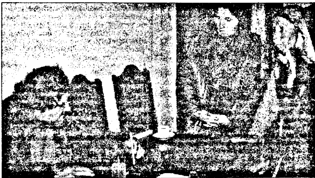
Viceprimarul asediat de nemulțumiri.

După puțin timp s-a pomenit cu chemare în fața tribunalului unde, în martie 1993, a avut din