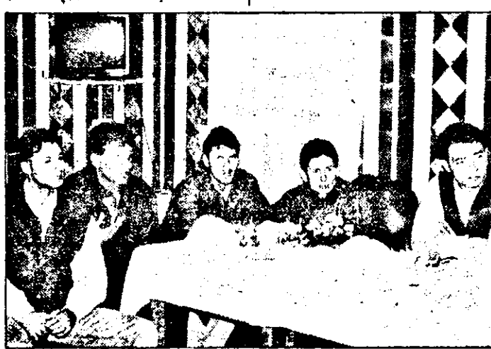
Ieri, la Clubul Preselor, o parte dintre „greviștii” UTA-ei.

Iată și alte opinii ale greviștilor: „Faptul că dl Ologeanu a dictat sancțiunile și nu a vrut să stea de vorbă cu noi înscamnă că se simte vinovat. Nu cred că în Arad agenții economici sunt dezinteresați de fenomenul sportiv” (Marți); „Fac parte din