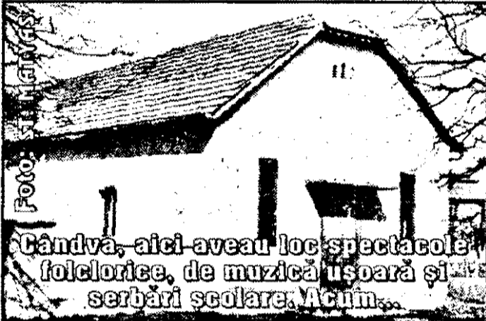
Cândva, aici aveau loc spectacole folclorice, de muzică ușoară și serbări școlare. Acum...