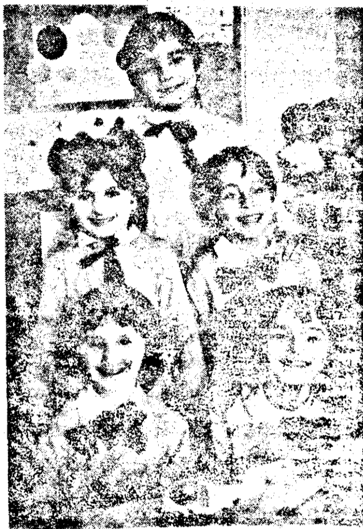
Zimbete de copii, sau viitorul la timpul prezent.