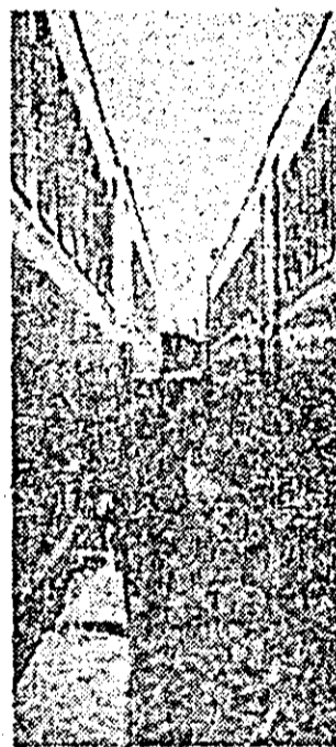
I.V.A., sectorul II. Un nou lot de vagoane este pregătit pentru a fi livrat la export.

cadru unităților aparținătoare s-au întreprins o serie de măsuri tehnico-organizatorice vizînd concomitent creșterea productivității și diversificarea gamei sortimentale, fapt ce a condus implicit la posibilitatea suplimentării comenzilor și lărgirii ofertei către beneficiarii externi. Pe această bază, de la începutul lunii ianuarie și pînă acum, programul de livrări la export a fost depășit pe relația C.T.S. cu o valoare de 23.000 de ruble iar pe cea de devize convertibile, cu 51.000 de dolari.