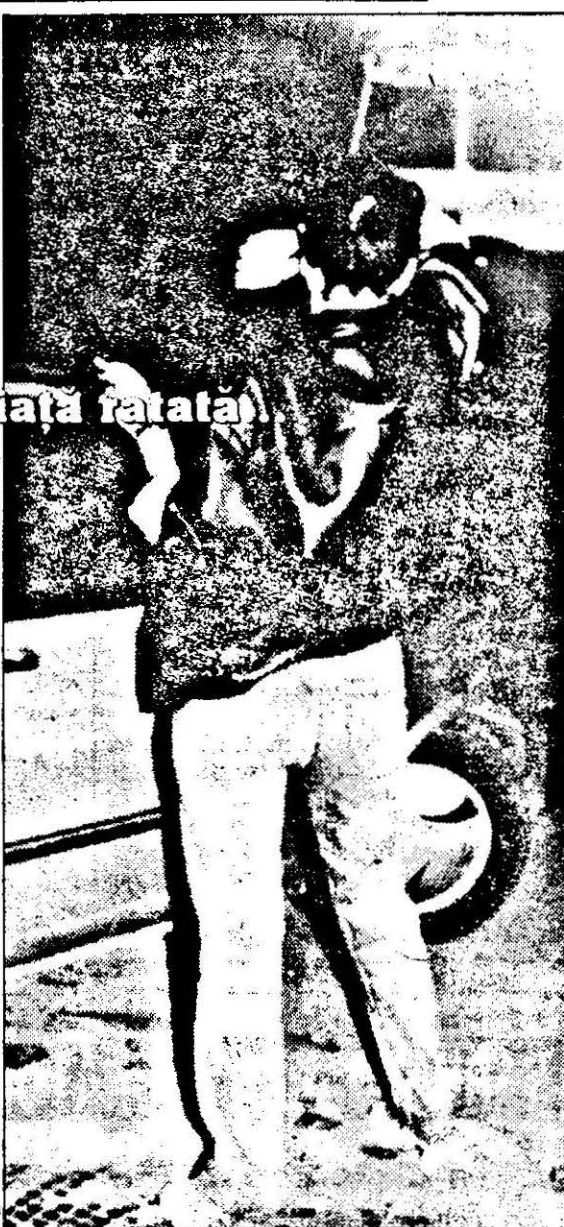
Hanul de la Râscruc: — Nu vreau să mă fotografiați, că mă vede prietenul!