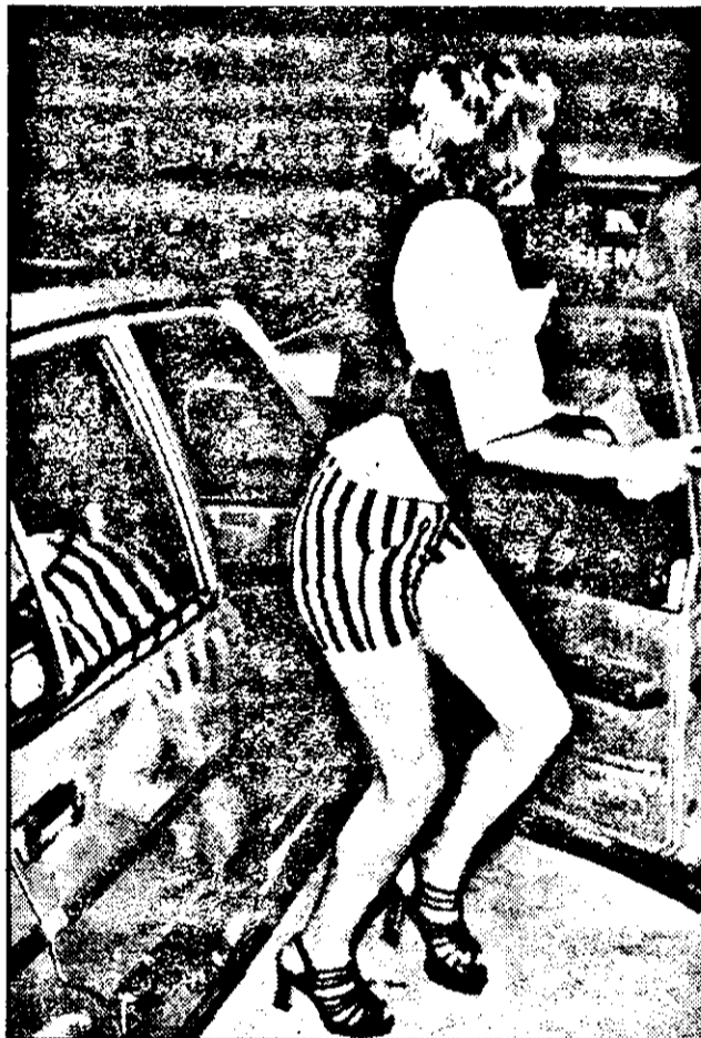
POPASUL MARA - După terminarea partidei de amor, fetele își iau mărcile și se îndreaptă spre un alt client.