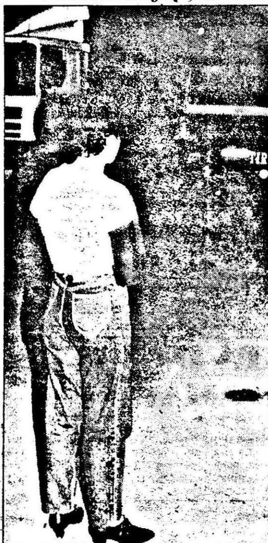
— Oare asta, care a venit cu tirul, mă cheamă în cabină?!

Plecând din zona Hanului de la Râscruc, următoarea „stație” a fost Anadolu - Mândruloc. Aici toate fetele erau la treabă. Adică, în ca-