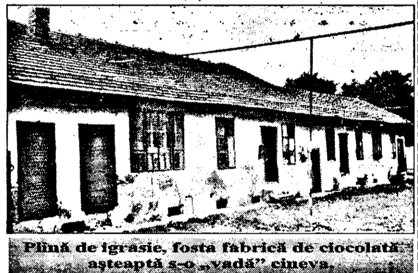
Plină de igrasie, fosta fabrică de ciocolată așteaptă s-o „vadă” cineva

Publice, care ar fi putut să se gândească la ceva în privința ei. După un timp, proprietarul imobilului a devenit S.C.I.L. Arad, pe atunci I.C.I.L. În prezent, o cameră a numărului muncitorilor a crescut,