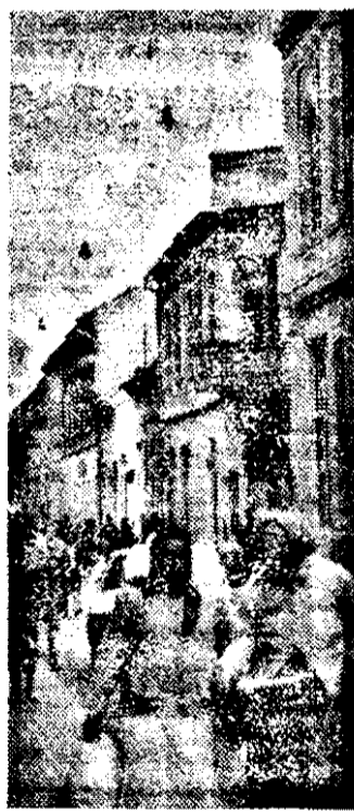
— Azi a fost o piață bună.