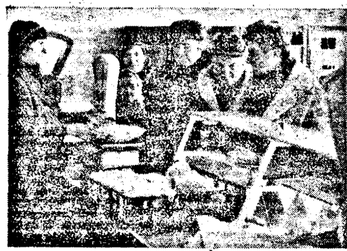
O imagine pînă mai ieri de neconșcut: carne de pasăre care poate fi cumpărată nu numai în cele trei zile însemnate cu roșu în calendar!