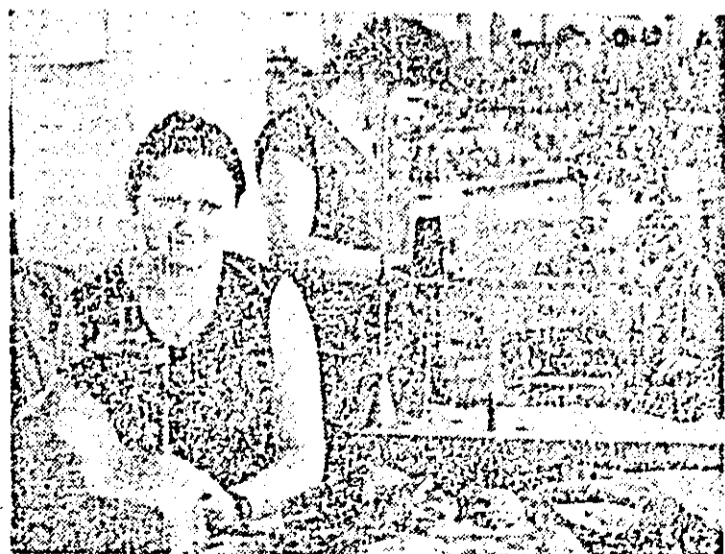
Aspect de muncă în secția a II-a a întreprinderii de confecții Arad.