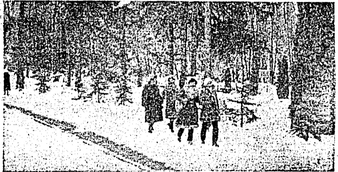
Iarna la Moneasa...