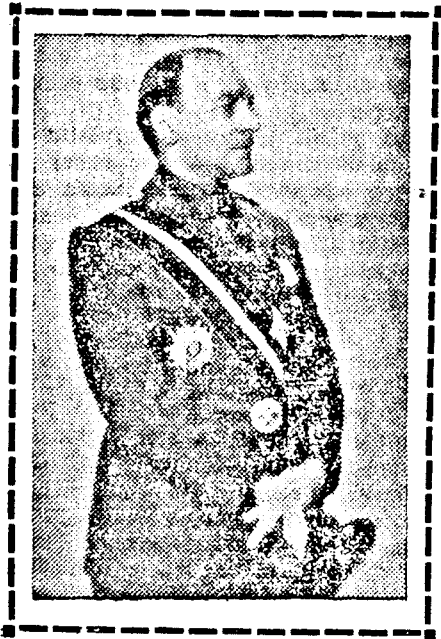
ARMAND CALINESCU helyettes kormányelnök

törvényt léptettünk életbe. Ez volt a régi rendszer legsebezhetőbb pontja. A volt kormányok minden kísérlete ezen a ponton hajótörést szenvedett. Az újítások révén hozzájárultunk a falusi irástudatlanság csökkentéséhez, a gazdaságok színvonalának emeléséhez és a városi értelmiség színvonalának emeléséhez. Egészségügyi téren szintén jelentős intézkedéseket tettünk, a gyermek és az anya védelmében, munkaügyi téren megszerveztük a céheket, javítottunk a munkaszerződéseken, javítottunk a nyugdíjügyeken és az aggkori biztosításon, jelentős eredményeket értünk el a szabadidő kihasználása terén. Ezen a téren oly eredményekhez jutottunk, amikkel a legdemokratikusabb kormány sem dicsekedhetik. A mezőgazdaságnak szintén új lendületet adtunk. Ezen a téren eddig egyetlen párt sem valósította meg azt, amit mi. Rendkívül nehéz nemzetközi versengés idején a mi termelőink 40.000 lejt kaptak egy vagon buzáért, amikor külföldön legfeljebb 20.000 leiert adhatták volna el.