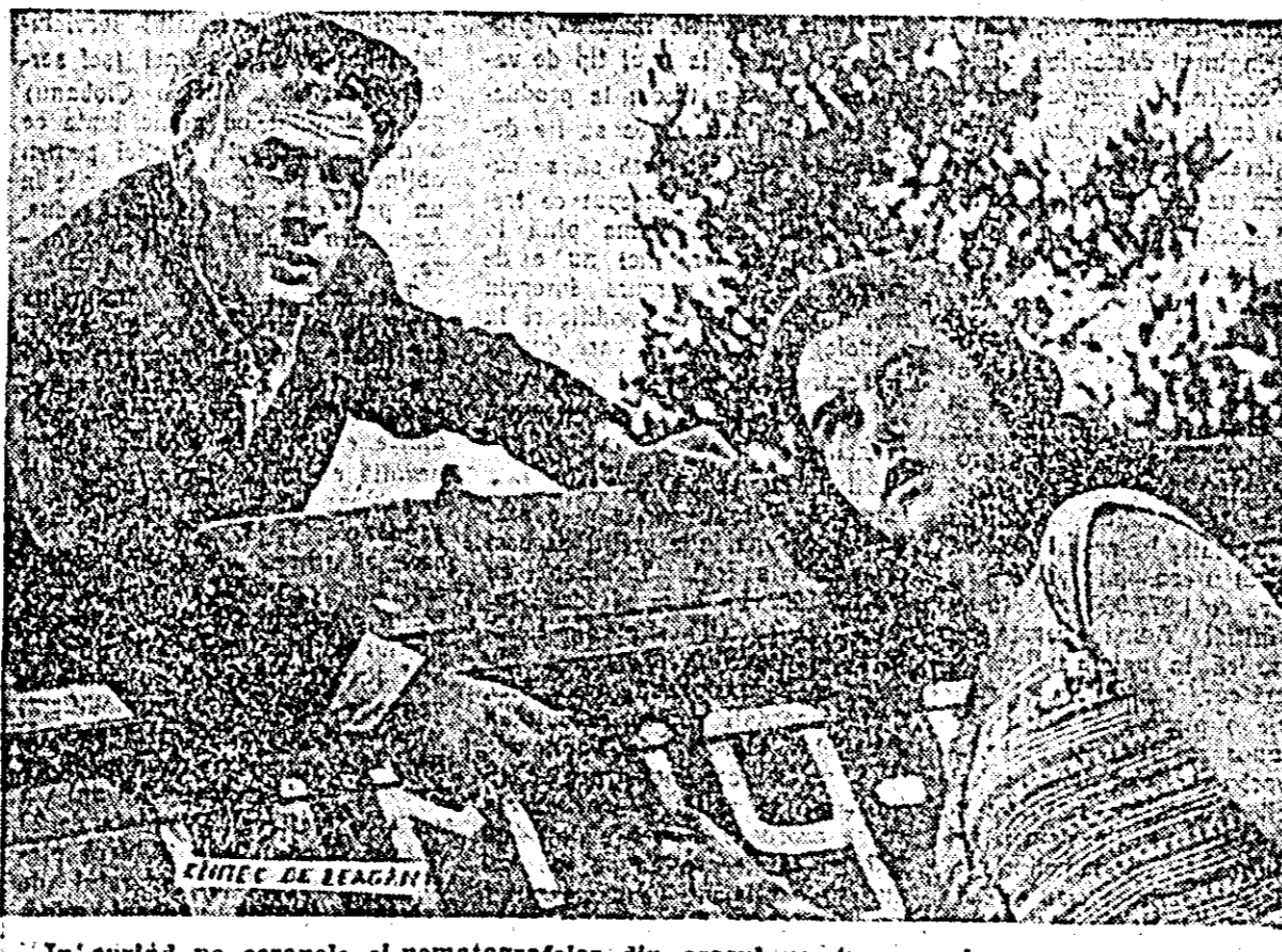
În curînd pe ecranele cinematografului din orașul nostru va rula o nouă producție a cinematografului sovietice: „Cîntec de leagăn”.

IERCOȘAN ȘTEFAN. Poezia „23 August” are o temă frumoasă, izvoară din realitatea vremurilor noastre: lureșul însuflețit cu care împlinim 23 August oamenilor muncii „din fabrici, uzine și ogoare”. Tema însă nu e bine tratată. Poezia e plată, neînșuflețită. Nu mai vorbim despre forma care lasă mult de dorit. Aceleași lucruri le putem spune și despre poezia închinată Congresului U.T.M. Care e concluzia noastră