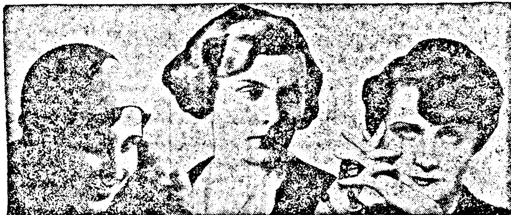
Balról jobbra: Miss Románia, Miss Ausztria és Miss Lengyelország. Ezek a szépségkirálynők képviselik országaikat az idei rio de janeiro nemzetközi szépségkirálynőversenyen.