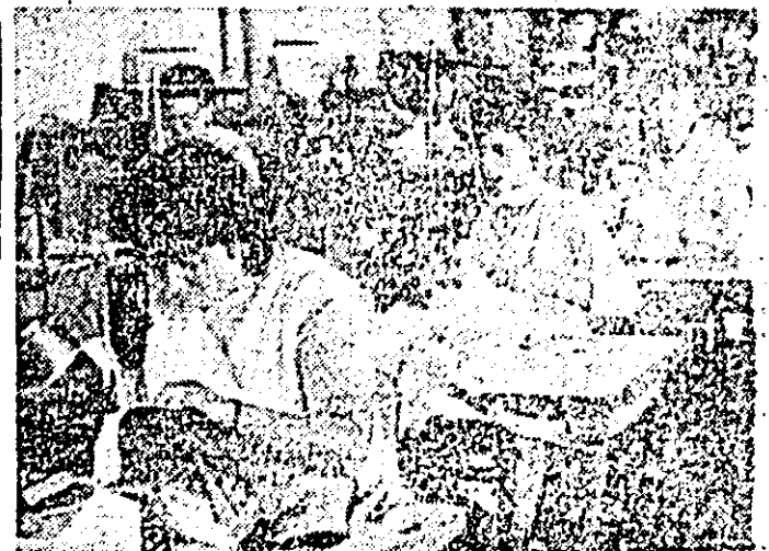
Aspect de muncă în atelierul pregătit-cusut al întreprinderii „Libertatea”.

fă suplimentară de 857 000 lei. Totodată, în bilanțul realizărilor obținute pe nouă luni se mai evidențiază, între altele, că sarcina de plan la livrări către fondul pieții a fost îndeplinită în proporție de 101,8 la sută, cît și faptul că produsele noi și modernizate dețin o pondere de 40 la sută în totalul producției, față de 39 la sută cît a fost stabilit.