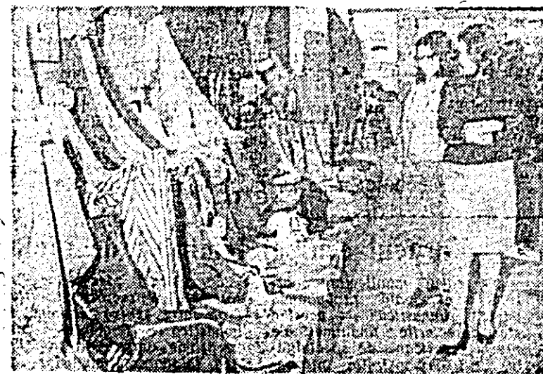
Aspect de la expoziția județeană a creației tehnico-științifice de masă, deschisă recent în sala „Forum”.

■ Carnet cultural ■ Mereu printre oameni... ■ Breviar pionieresc ■ Sport ■ Mica publicitate ■ Actualitatea internațională.