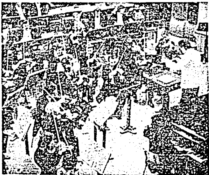
Repetiții la Filarmonica de stat Arad.

nici pe cel mai tineri interpreti (premiati la diferite concursuri de interpretare sau cel care bat la porțile afirmării artistice), pentru care am inaugurat recent ciclul de concerte „Tineri talente”, iar împreună cu Asociația oamenilor de teatru și muzică vom organiza (și în această stagiune) — „Tribuna tinerilor interpreti”. Pe lângă concertele simfonice, vom avea și o bogată activitate camerală susținută de formațiile cu acest profil, alcătuite din artiști-instrumentiști membri ai orchestrei și corului filarmonicii. Nu vom neglija nici concertele destinate tineretului și elevilor, iar concertele-lectii de literatură muzicală vor fi susținute atât la sediu, cît și în municipiul și diferite localități ale județului nostru. Alături de orchestra simfonică, corul dirijat de Doru Șerban participă activ la viața muzicală a orașului și județului prin concertele vocal-simfonice și „a cappella” pe care le susține. Remarcăm în acest context repertoriul deosebit de valoros al corului, alcătuit atât din lucrări patriotice, închinare patriei și patriei, cît și prelucrările folclorice pe care le interpre-