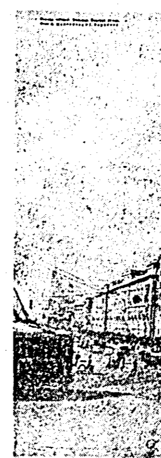
Vedere din Moscova de azi.